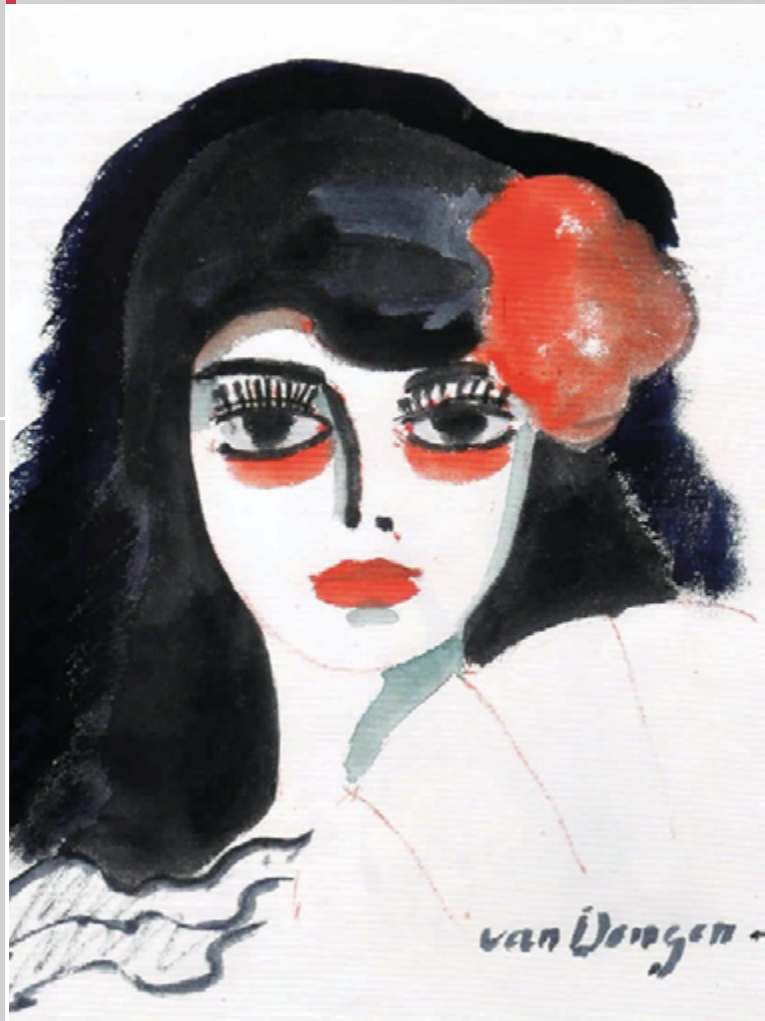
Kees Van Dongen, Œuvre non identifiée, s. d.

15 - 16 SEPTEMBRE 2023 PALAIS DES CONGRÈS